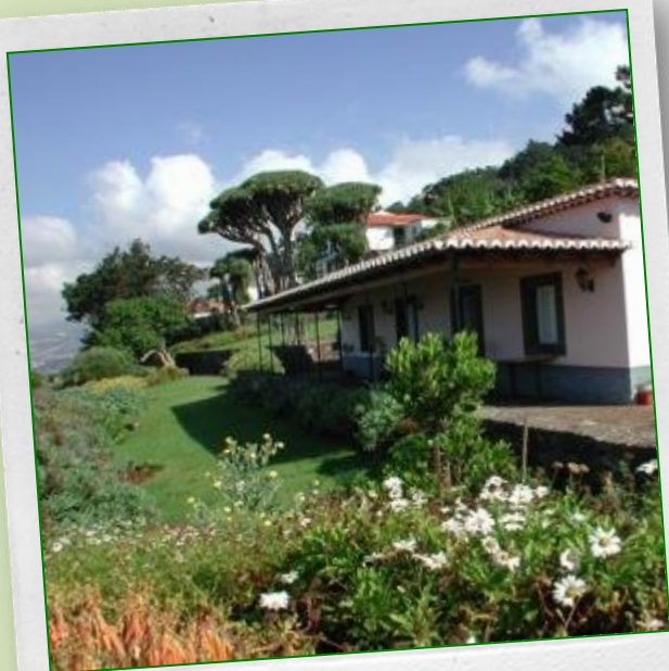
Núcleo dos Dragoeiros das Neves