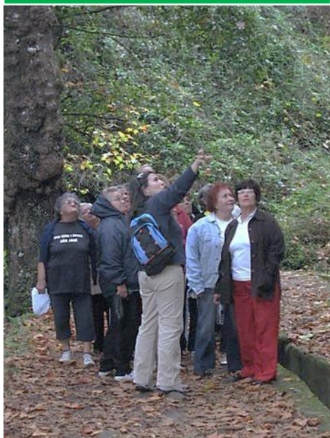
Visita de estudo à Floresta Laurissilva – Percurso dos Balcões